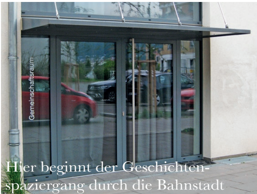
Hier beginnt der Geschichten-spaziergang durch die Bahnstadt

Die beliebten Geschichten von „ Die Schule der Magischen Tiere “ werden verfilmt. Stell dir vor, man hätte das Buch hier in der Bahnstadt verfilmen wollen. Wäre das gelungen?