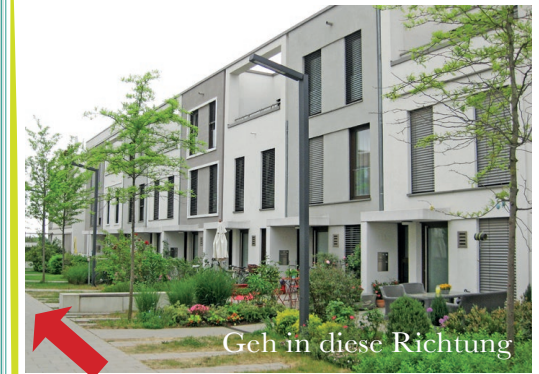
Geh in diese Richtung

Ihr erreicht eine Weg-Kreuzung. Hier hilft euch das SUCHBILD weiter.