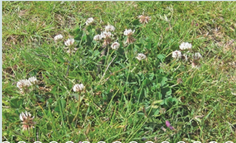
KLEEBLATT vom GADAMERPLATZ